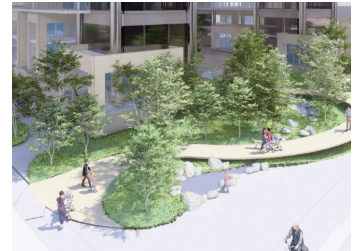
「光」「水」「緑」がキーワードになる公開空地。「美しく居心地の良い共有空間」としてデザインされます。中央部3箇所に「光庭」と呼ばれる吹き抜け空間やビオトープが設置されるなど、たくさんの方が訪れる憩いの空間となるでしょう。