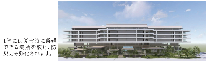
1階には災害時に避難できる場所を設け、防災力も強化されます。