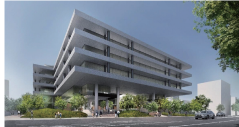
株式会社十六フィナンシャルグループが入居するオフィスと、地域の方が気軽に集い利用できる空間に配置した複合ビル「16FG オフィス&パーク」。

新たなにぎわい空間が生まれることにより、岐阜駅、玉宮町、セントラルパーク金公園、柳ヶ瀬、「16FGオフィス&パーク」、つかさのまち(岐阜市役所・ぎふメディアコスモス)、岐阜公園のそれぞれのエリアがつながり、まちと人のにぎわいがさらに高まることが期待できます。