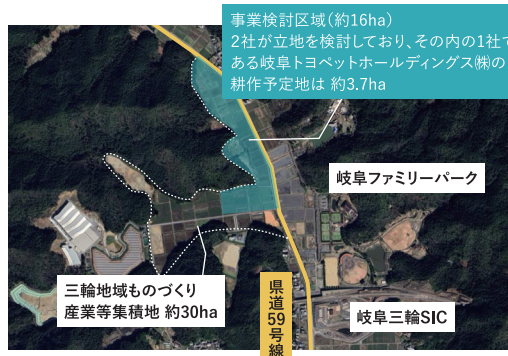
事業検討区域(約16ha) 2社が立地を検討しており、その内の1社である岐阜トヨペットホールディングス株の耕作予定地は約3.7ha

2024年には、株式会社光製作所が柳津地域ものづくり産業等集積地(第2期)の立地協定を、岐阜トヨペットホールディングス株式会社が三輪地域ものづくり産業等集積地で農業6次産業化の事業を実施する基本協定を岐阜市と締結しました。