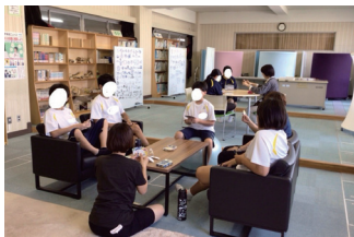
校内フリースペース