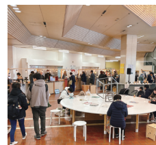
金公園と一体となったイベント活用もすすめられます。

セントラルパーク『金公園』からの延長利用ができる場所、また、文化芸術を感じられる場所となるよう、R7年度には1階ロビーの活用調査と実施計画を予定しています。