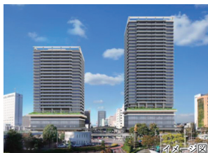
老朽化した建物を建て替え、魅力ある岐阜都市圏の玄関口として整備します。

岐阜駅北中央東・中央西地区第一種市街地再開発事業のツインタワーが20階建て程度と30階建て程度に検討され、時代に合わせた再開発がすすめられています。今後、新たな商業施設や住宅、広場などの整備により、都市機能の更新が期待されています。