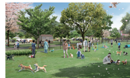
ドッグランのイメージ

「緑の中で”まるごと1日”わくわく体験できる公園」をコンセプトにした再整備が予定されています。