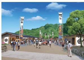
岐名城下に誕生する現代の「楽市楽座」。賑わいとおもてなしの象徴となることが期待できます。

岐阜公園に官民連携の飲食物販施設「岐名城楽市」が4月26日にオープンし、地域食材を使用した料理を提供する飲食店など11店舗が出店します。そのほか、イベントなどを開催可能な約1000平方メートルの芝生広場などが新たに設けられます。また、今後、岐阜市歴史博物館のリニューアルも予定されています。