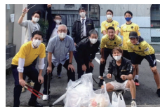
玉宮町の早朝掃除に参加。安心できる地域を目指して活動しています。