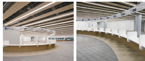
窓口数は23ブース、39種類91項目、証明49種類の事務を取り扱います。(3月撮影)

新庁舎は「市民に開かれた庁舎」として、毎日、誰もが利用できる市民開放スペースが設置されます。