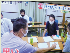
▲各新聞社、CCN、メ〜テレ「アップ」で紹介されました。