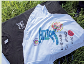
▲お揃いのTシャツで気持ちを一つ!