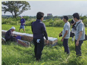
▲万全を期した準備。