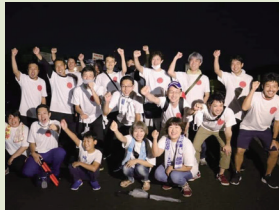
▲一緒に実行委員会を立ち上げた仲間。

市橋小学校PTAを中心に実行委員会を立ち上げ、市橋自治会連合会、市橋小学校、地域の団体、地元企業のみなさんにご協力をいただきました。