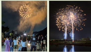
◀市橋花火と鏡島花火は8月22日にそれぞれ約300発、長良川鶴飼屋花火大会は8月29日に約2000発が上がりました。

2020年は新型コロナウイルス感染防止の観点から、春からさまざまな地域行事やイベントが中止・延期されています。岐阜市は、9月末までの主催イベントを全て中止と決定しました。しかし、「子どもたちのために夏の思い出を作りたい」「医療従事者に感謝の想いを込めたい」と、市民が協力し合い、三密を避ける形で各地で花火の打ち上げが行われました。花火の打ち上げ日時や場所はシークレットでしたが、たくさんの方の笑顔が見られました。