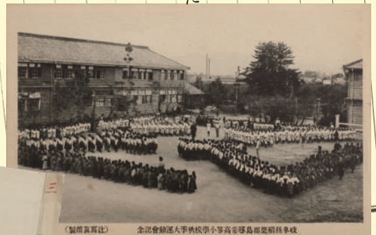
島尋常高等小学校秋季大運動会記念絵はがき 大正9年(1920)