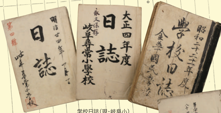
学校日誌(現・岐阜小) 明治～昭和時代 岐阜市歴史博物館蔵