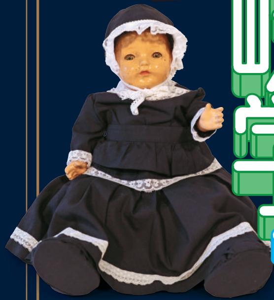
青い目の人形「メリーブランナー」 1920年代半ば 七宗町立上麻生小学校蔵