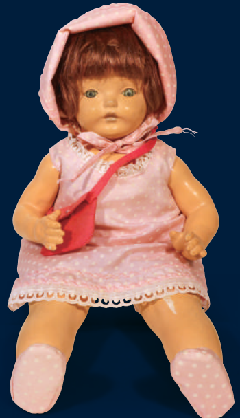
青い目の人形「パッテロー」 1920年代半ば 八百津町立和知小学校蔵