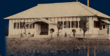
④ 迎藏学校 (現・市橋小)