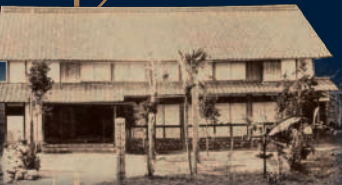
① 東雲学校 (現・合渡小)